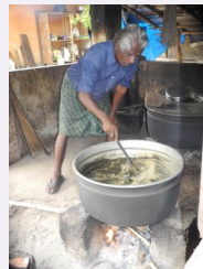
Medizinmann beim Zubereiten von Medizin

Ayurveda ist eine 5000 Jahre alte Wissenschaft, ein lebendiges, stets anwachsendes Wissen zur Förderung von Gesundheit, natürlicher Schönheit und Langlebigkeit. Eine ayurvedische Panchakarma- oder Entgiftungskur unterscheidet sich vom „Wellnessayurveda“, wie es meist bei uns angeboten wird und wirkt tief und anhaltend. Die Einheit von Körper, Geist und Seele wird bei der Behandlung mit einbezogen.